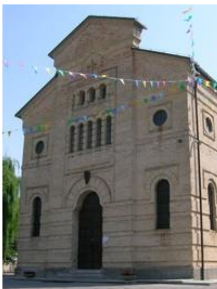
Chiesa di San Giovanni del Tempio